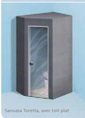
Sanoasa Toretta, avec toit plat