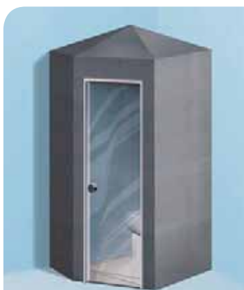
Sanoasa Toretta, avec toit en pointe