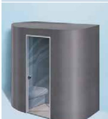
Sanoasa Capricia, avec toit plat