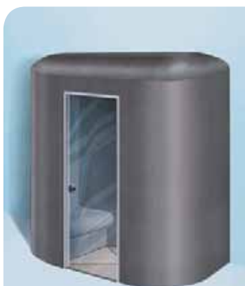
Sanoasa Capricia, avec toit en dôme