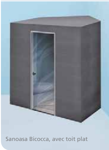
Sanoasa Bicocca, avec toit plat