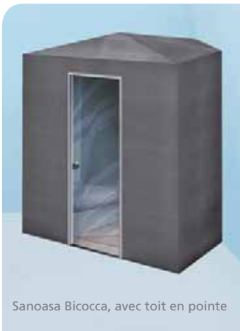
Sanoasa Bicocca, avec toit en pointe