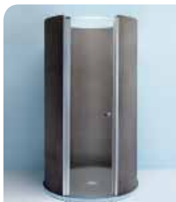
Porte battante de Fundo Trollo, douche design