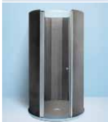
Porte battante de Fundo Trollo libero , douche design